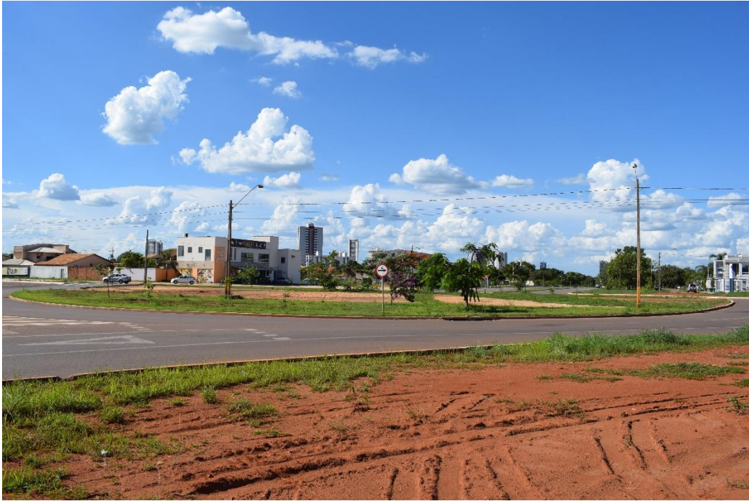
Fotografia 07: Rotatória da NS-05 com a LO-09, Palmas-TO.