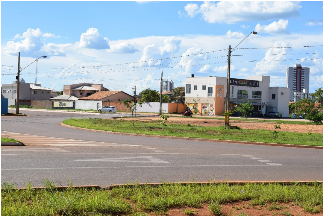
Fotografia 08: Rotatória da NS-05 com a LO-09, Palmas-TO.