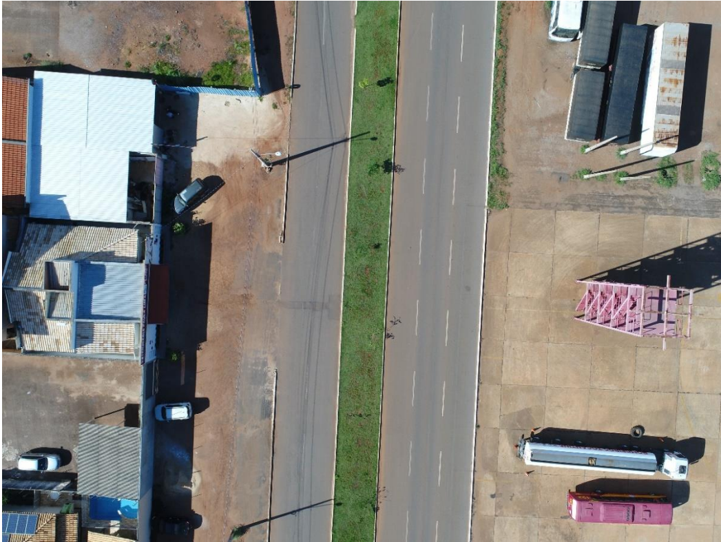
Fotografia 13 georeferenciada: Av. NS-05 ao lado do 1º Batalhão do Corpo de Bombeiros, Palmas-TO.