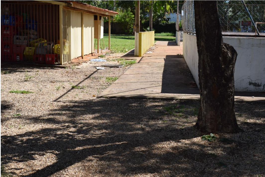
Fotografia 05: Praça da 108 Norte, Palmas-TO: área de pedrisco entre quiosque e quadra de esporte.