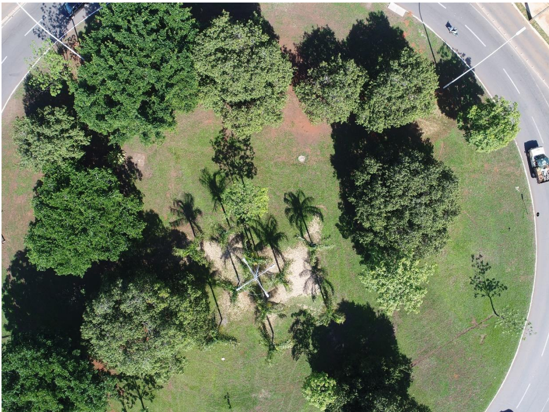
Fotografia 06 georeferenciada: Rotatória da NS-02 / LO-05, Palmas-TO.