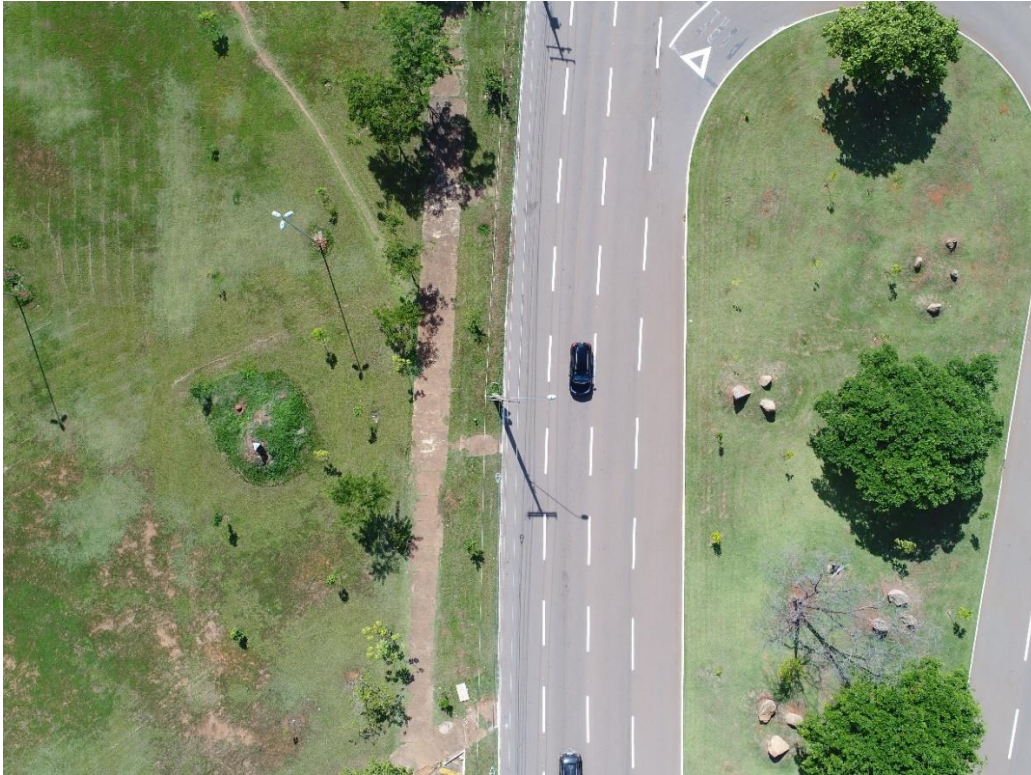
Fotografia 11 georeferenciada: Av. LO-05 em frente ao Espaço Cultural, Palmas-TO.