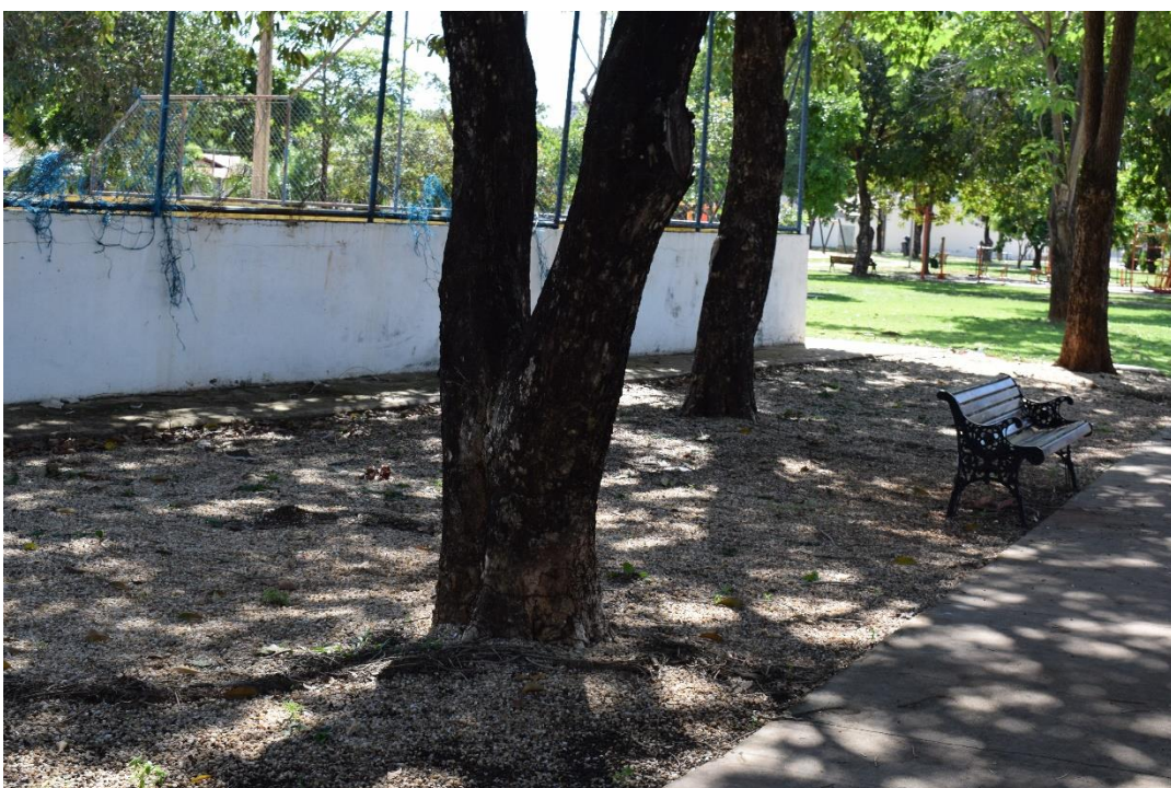
Fotografia 04: Praça da 108 Norte, Palmas-TO: área de pedrisco entre calçada e quadra de esporte.