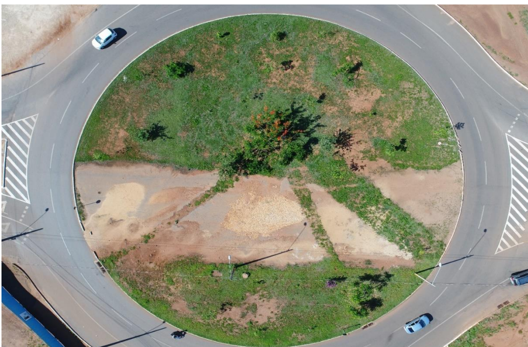
Fotografia 09 georeferenciada: Rotatória da NS-05 com a LO-09, Palmas-TO.