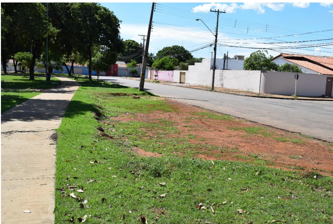
Fotografia 03: Praça da 108 Norte, Palmas-TO: Estacionamento. Fonte: equipe de auditoria da CAENG em (16/12/2019).