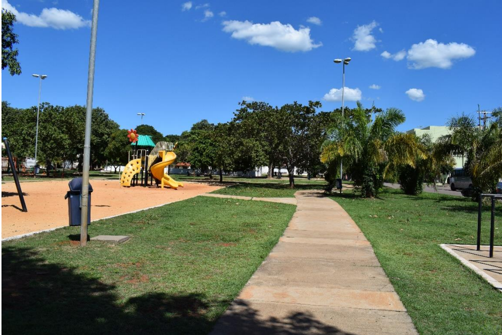
Fotografia 01: Praça 108 Norte, Palmas-TO. Equipamento de ginastica, calçadas, parque de areia. Fonte: equipe de auditoria da CAENG em (16/12/2019).