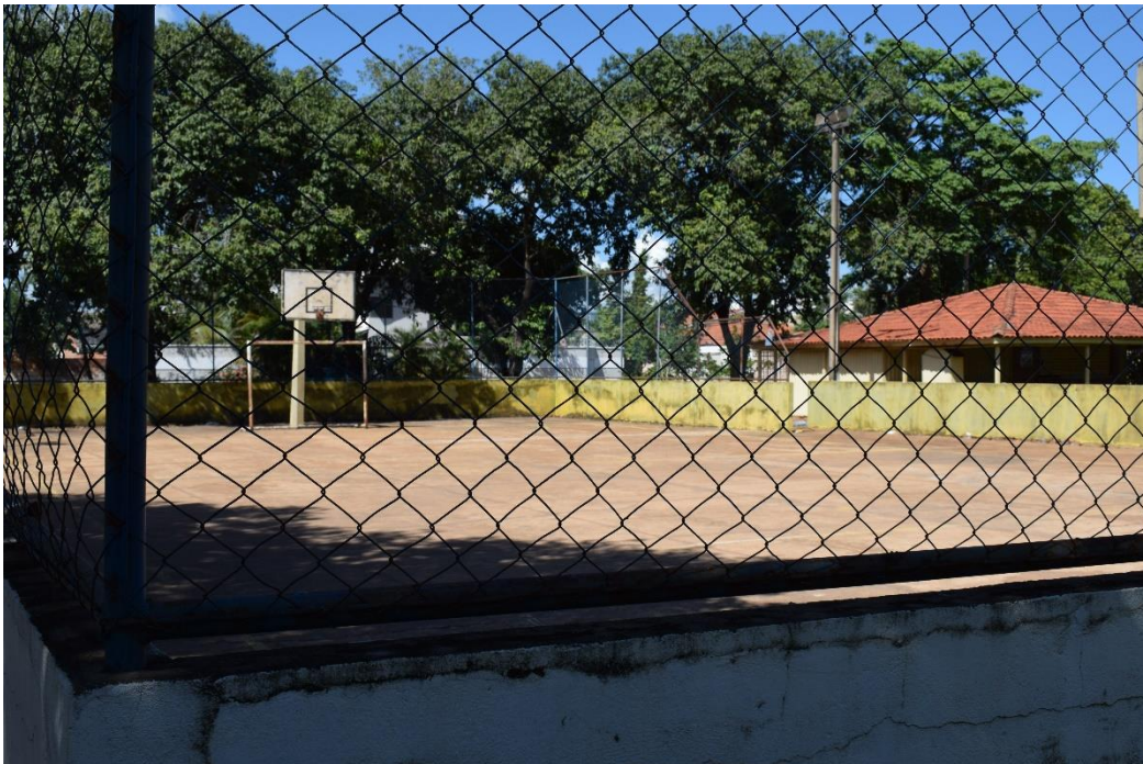
Fotografia 02: Praça da 108 Norte, Palmas-TO: quadra poliesportiva, quiosque.